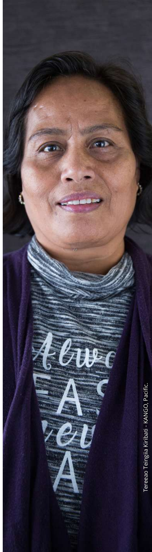
Tereao Teingia Kiribati - KANGO, Pacific.